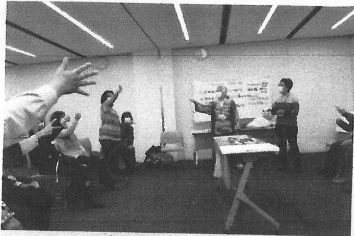
リボン取りゲーム