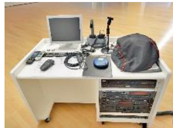
【ワイヤレスマイク(ハンド型)】

仕様等 二式(全体/分割スイッチにより、 ホールB・Cの分割使用に対応) DVD/HDD/VHS/MD/CD(レコーダー)/カセットデッキ ハンド型マイク(×2)、タイピン型マイク(×2)